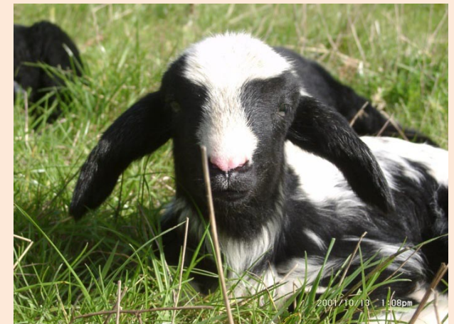
Ein stolzes Bocklamm

Das Gesichtsfeld, der Bauch und die Füße sind in der Regel unbewollt. Das Vlies ist mischwollig mit langen Grannenhaaren und feiner Unterwolle. Es kommen alle Wollfarben und Farbzeichnungen vor, vor allem auch graue Wollen.