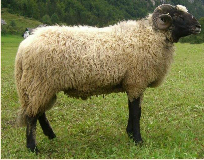
Typischer Zuchtbock der Rasse Alpines Steinschaf