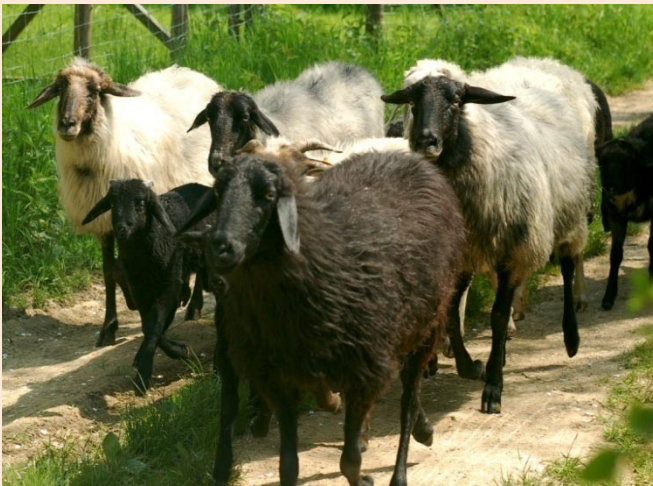
Typische Zuchtschafe der Rasse Alpines Steinschaf